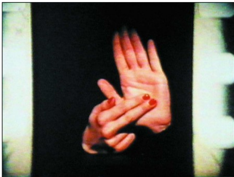
VALIE EXPORT, Syntagma, 1983 © VALIE EXPORT, Bildrecht Wien, 2024